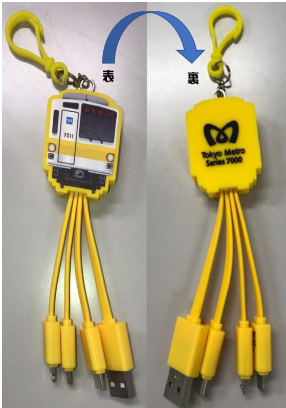
有楽町線 7000 系