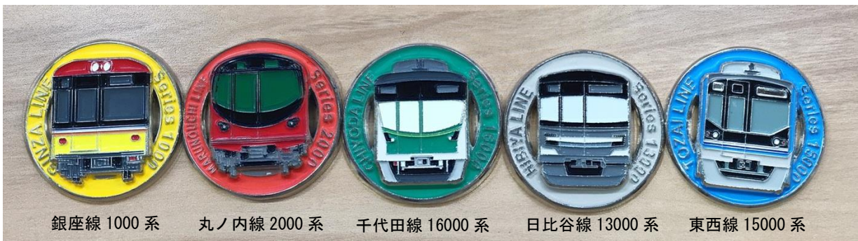
銀座線 1000 系