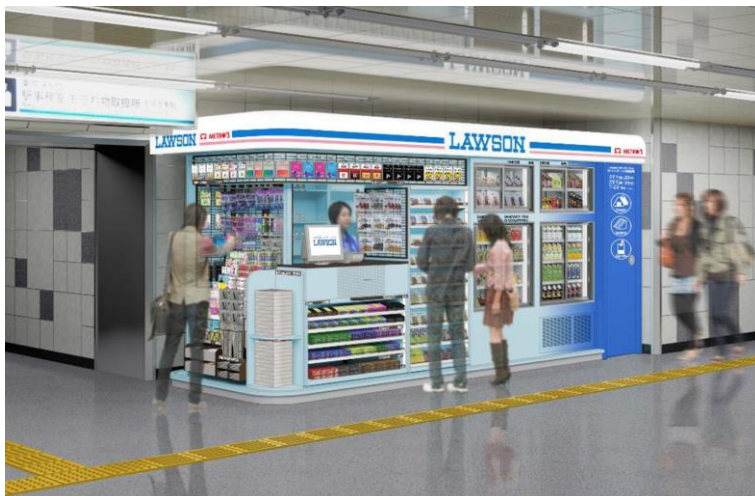
【「ローソンメトロス秋葉原店」イメージ図】

3社は2020年に向け、増加する外国人観光客に向けたサービスや情報発信、商品の品揃えなどで協力し、首都の支えるインフラとしての機能を向上させた新しいスタイルの駅ナカコンビニを構築してまいります。