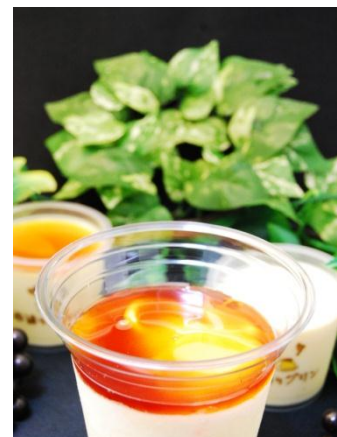
プリン de シェイク 価格：320円（税込）