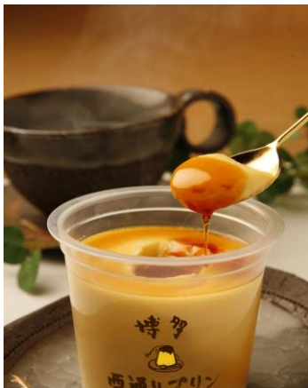
ポシェ 価格：270円（税込）