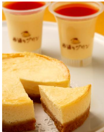
プリン de チーズ ポシェ 価格：1,365円（税込）