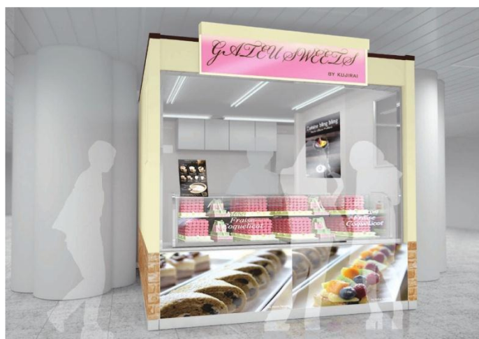
ショップイメージ